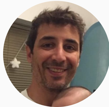
LUCIANO DE PAOLIS